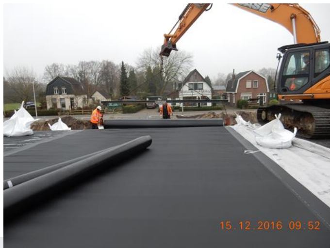
Foto: aanbrengen HDPE-Folie