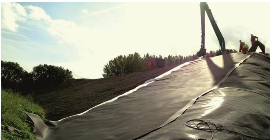
Foto: overzicht aanleggen IBC werk.

Organisaties met een accreditatie conform AS SIKB 6900 versie 1.0 kunnen tot 1 april 2020 hun accreditatie om laten zetten conform AS SIKB 6900 versie 2.0 verkregen na een positief verlopen accreditatie-onderzoek. Dit onderzoek valt binnen de jaarlijkse steekproef. Afgegeven accreditaties conform AS SIKB 6900 versie 1.0 die niet voor 1 april 2020 worden omgezet, worden ingetrokken. Het is niet mogelijk om accreditatie te verkrijgen voor dit schema, versie 2.0 in combinatie met protocollen met een lager versienummer dan 2.0.