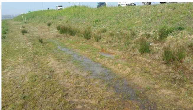
Foto: verzadiging teen talud.

Het opleidingssysteem borgt dat inspecteurs (intern of extern) worden bijgeschoold als AS SIKB 6900 inhoudelijk wordt gewijzigd.